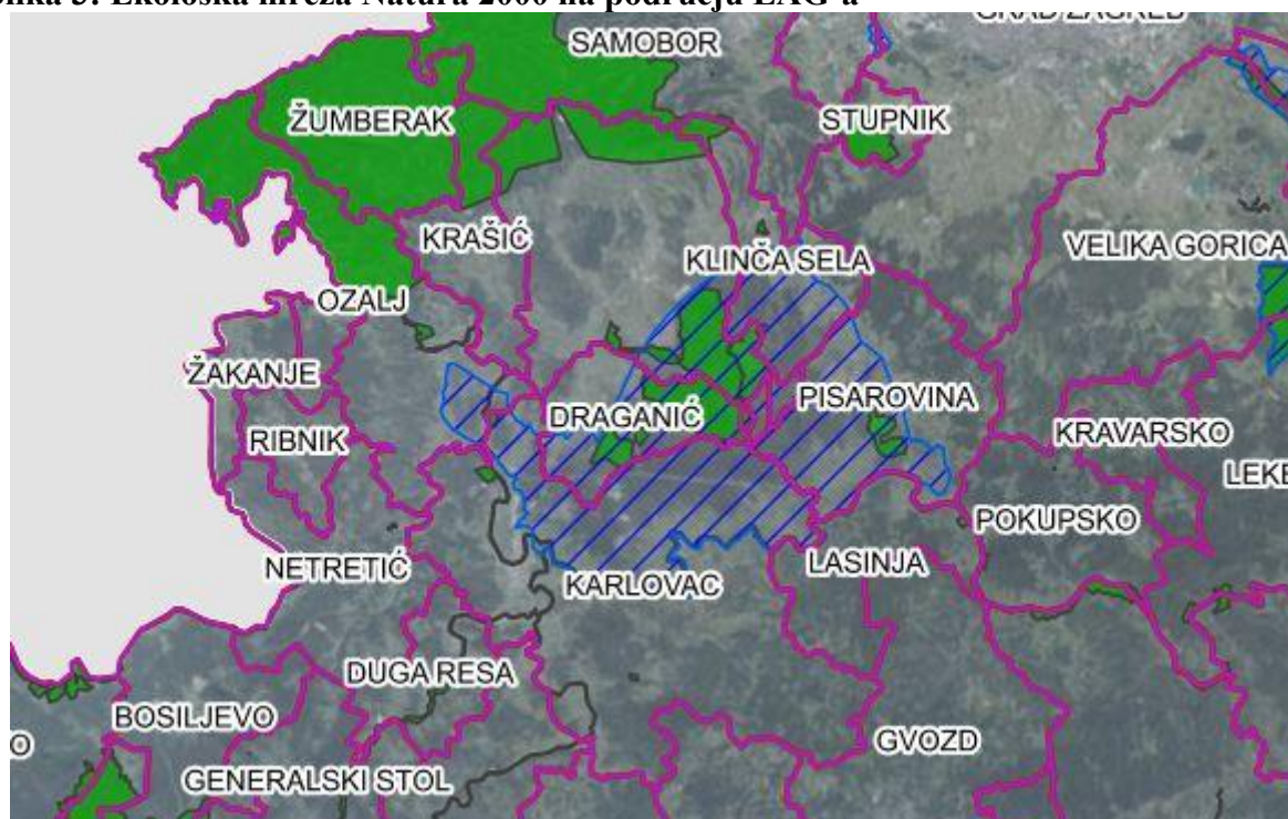
Slika 3: Ekološka mreža Natura 2000 na području LAG-a